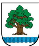
Burmistrz Gminy Konstancin-Jeziorna